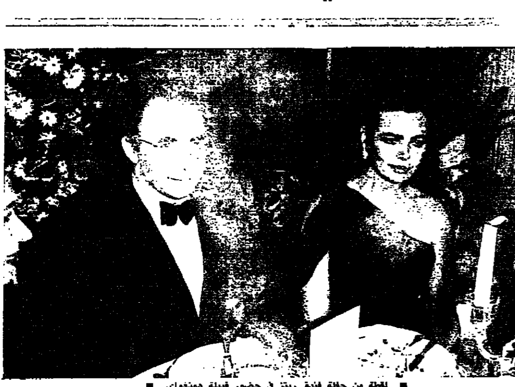
حفيدة من حفلة فندق ريتز في حضور حفيدة همنغواي